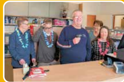
Plein 1: Pleinshop