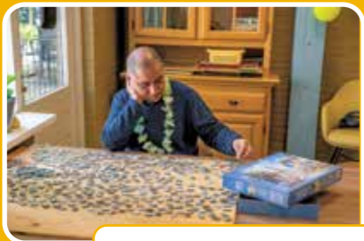
Plein 1: Hysop