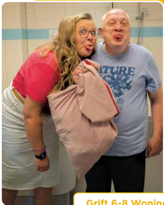
Grift 6-8 Woning