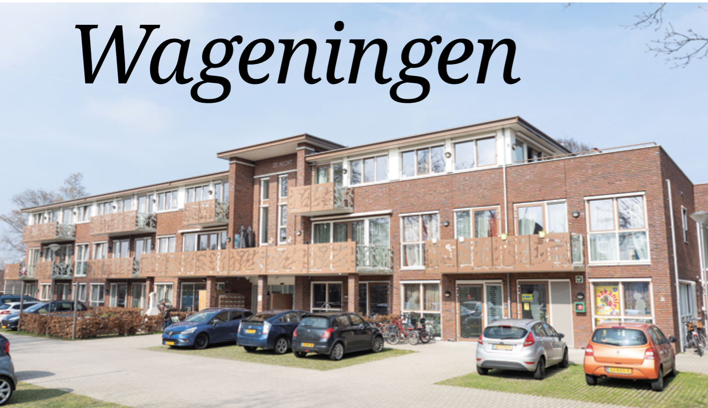
Generaal Foulkesweg (De Hucht)