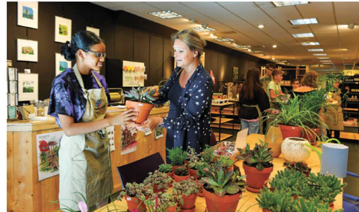
KadoLokaal, foto: Peter Drent

“Elke cliënt heeft een persoonlijk begeleider. Deze brengt samen met de cliënt de dromen van hem/haar in kaart. Deze dromen worden